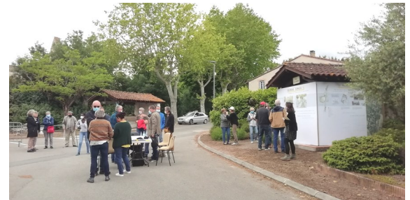
Concertation à Roumens en mai 2021

Nous saluons tout de même les bonnes idées recueillies lors de la concertation de mai 2021.