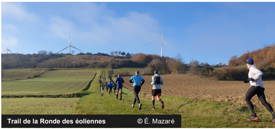
Trail de la Ronde des éoliennes